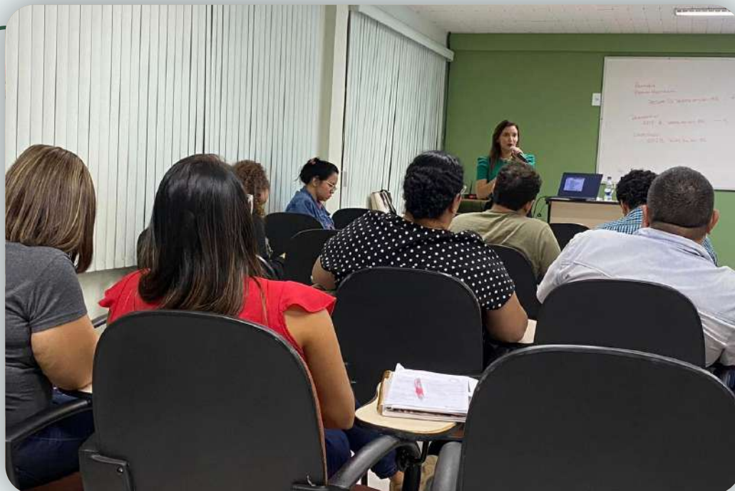
ALUNOS DURANTE O CURSO DE DESEMBARAÇO E TRIBUTAÇÃO